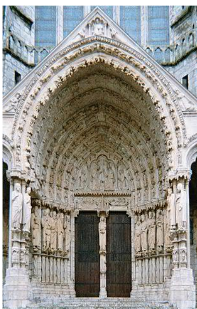
Portal in Chartres